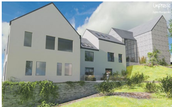
Wizualizacja budynku wielorodzinnego w Cedyni

2. Wprowadzono Zachodniopomorską Kartę Dużej Rodziny i Kartę Seniora. Od uruchomienia programu wydano 201 kart dużej rodziny dla 47 rodzin oraz 58 kart seniora. W program włączyło się 5 podmiotów gospodarczych z terenu naszej gminy, które oferują zniżki m.in. na zakupy, usługi gastronomiczne i hotelowe. Ponadto, posiadacze kart, przebywający poza terenem naszej gminy, mogą korzystać z katalogu ofert w zakresie kultury, edukacji, rekreacji, transportu i innych usług oferowanych przez partnerów programu w wielu miastach województwa zachodniopomorskiego.