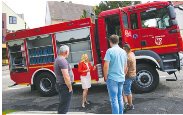
Nowy samochód bojowy OSP Osinów Dolny

W ostatniej kadencji do jednostek OSP w gminie trafiło ponad 2 miliony 43 tys. zł na zakup samochodów, łodzi ratowniczej, defibrylatorów, toreb medycznych, wyposażenia, mundurów, środków ochrony osobistej, rozbudowę i remonty remiz, ekwiwalent za udział w akcjach, na wynagrodzenia, szkolenia i badania lekarskie.