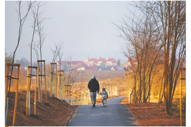
Ścieżka pieszo-rowerowa na odcinku Cedynia–Radostów