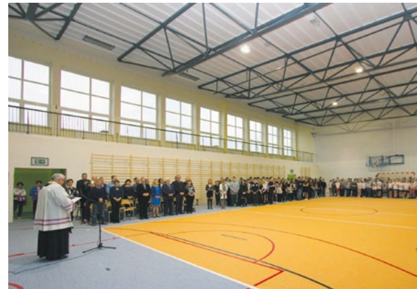
Otwarcie sali gimnastycznej po remoncie