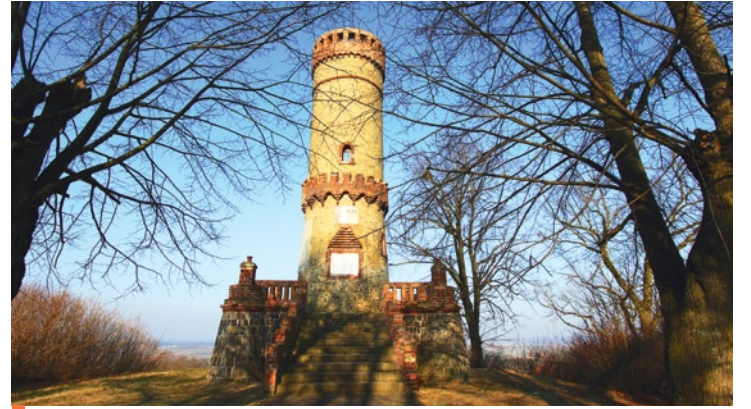
Wieża widokowa w Cedyni

do rekreacji ruchowej dla dzieci na placu zabaw. Wnioskowano również o środki na budowę wiaty i montaż piłkochwytyw. Rozstrzygnięcie konkursu planowane jest na maj 2018 r.