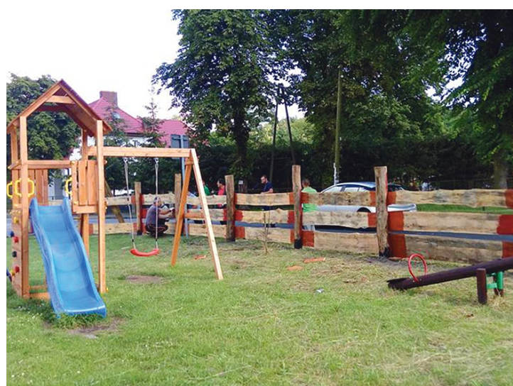
Nowy płot przy placu zabaw w Bielinku

Rada wyrażając zgodę na wyodrębnienie danego funduszu podejmuje stosowną uchwałę do 31 marca roku poprzedzającego rok budżetowy. Można także, korzystając z przepisów ustawy podjąć uchwałę w taki sposób, aby znajdowała zastosowanie do kolejnych lat budżetowych, co ma miejsce w gminie Cedynia.