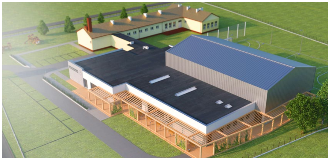
Wizualizacja przyszłego wyglądu Szkoły Podstawowej w Piasku

przebiegnie zgodnie z planami, to już w tym roku na kąpielisku otoczonym nowym ogrodzeniem będziemy mogli skorzystać z przebieralni.