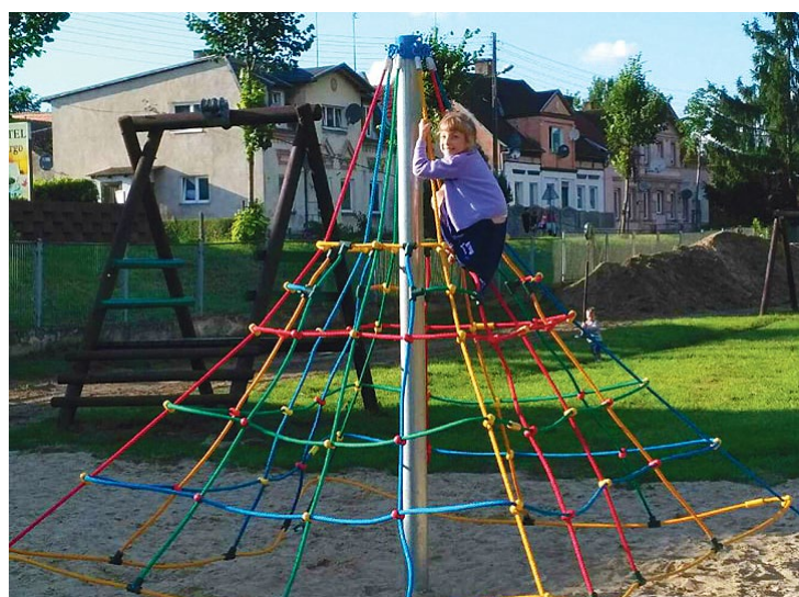
Plac zabaw w Lubiechowie Górnym