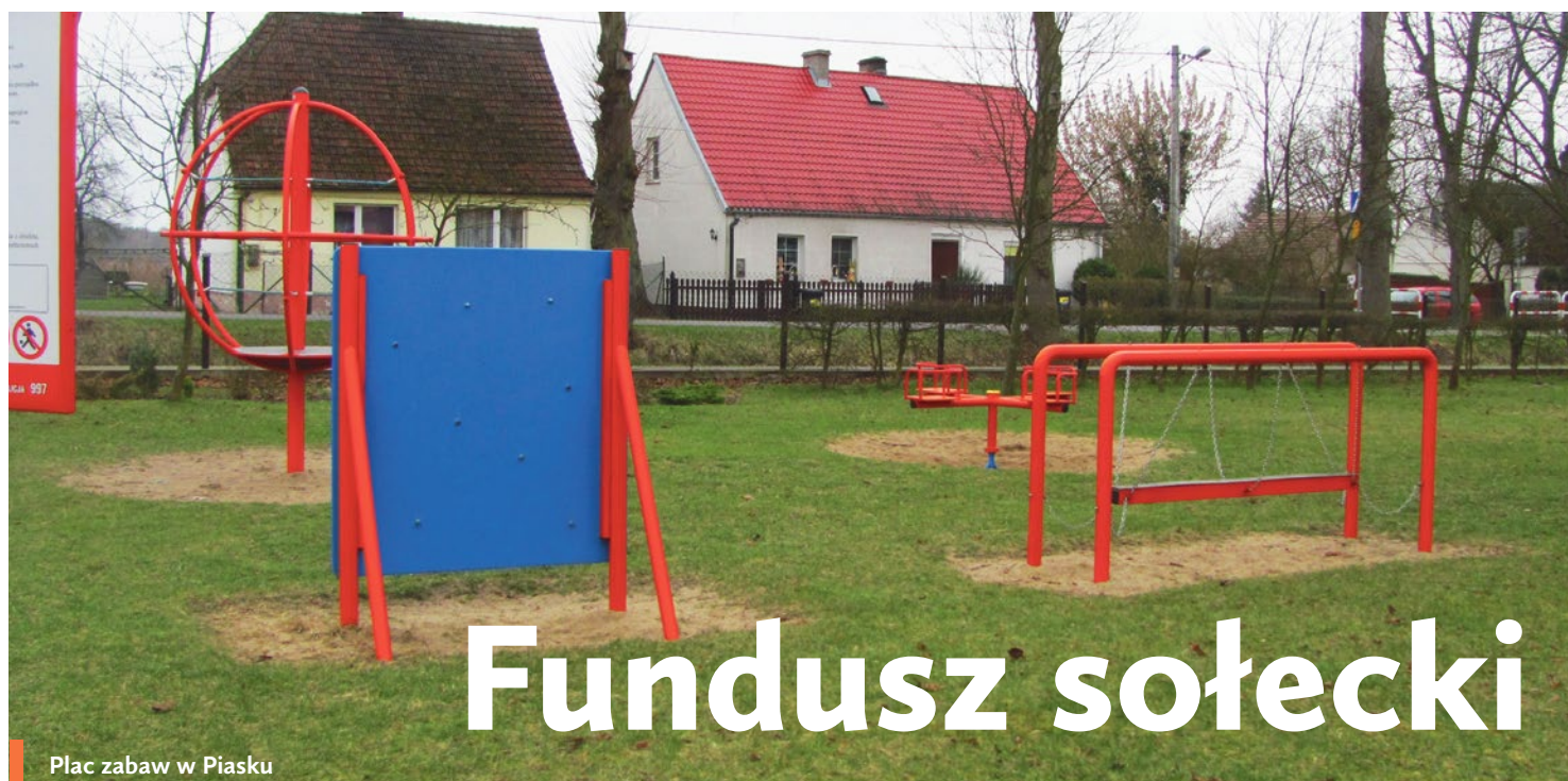
Plac zabaw w Piasku

Fundusz sołecki to pojęcie, które funkcjonuje w przestrzeni publicznej od 2009 roku, kiedy to na mocy ustawy z 20 lutego 2009 r. o funduszu sołeckim, nadano radom gminy prawo rozstrzygnięcia o wyodrębnieniu w budżecie gminy środków stanowiących fundusz sołecki.