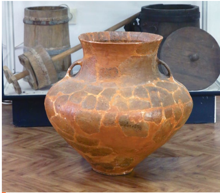
Neolityczne naczynie zasobowe ze zbiorów Muzeum Regionalnego w Cedyni

Jednak teren, gdzie dziś znajdują się zabudowania miejscowości Cedynia oraz jej okolice już w dalekiej przeszłości zamieszkiwany był przez liczne grupy ludzi. Celem mojego tekstu jest przybliżenie czytelnikom zagadnienia osadnictwa w tym rejonie w młodszej epoce kamienia (neolicie), która datowana jest na okres około 5400–2350 przed Chrystusem. Neolit to czas wielkich zmian, które rozpoczęły się na terenach bliskowschodnich. Doszło tam do rewolucji w dziedzinie dotychczasowego modelu gospodarki polegającej na wprowadzeniu uprawy roślin i hodowli