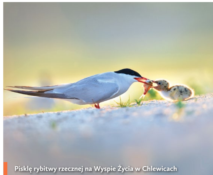
Pisklę rybitwy rzecznej na Wyspie Życia w Chlewicach

Niewielu ludzi zdaje sobie sprawę, jak bardzo Odra, powszechnie znana i urocza wizytówka naszego regionu, zmieniła się pod wpływem ludzkiej ręki.