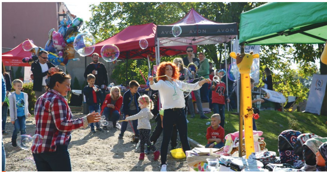
3. polsko-niemiecki Festiwal CeDynia na okrągło