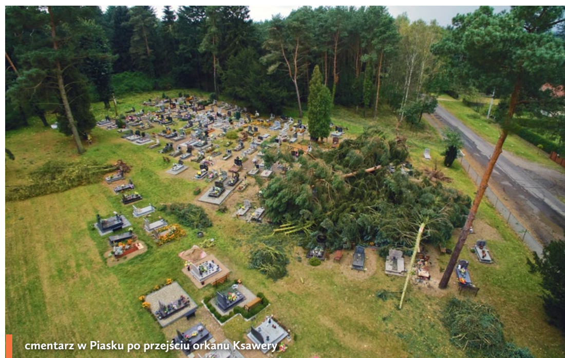
cmentarz w Piasku po przejściu orkanu Ksawery

Zainteresowanych tematem latania zapraszamy na fanpage Motoparalotnie nad Odrą, gdzie na bieżąco umieszczane są informacje o tym, kiedy i gdzie odbędzie się kolejne spotkanie grupy.