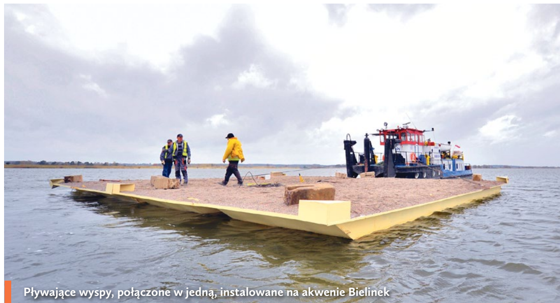
Pływające wyspy, połączone w jedną, instalowane na akwenu Bielinek