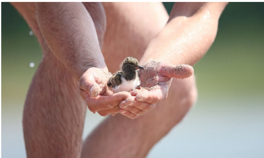
Pisklę ostrzygojada, widok bezcenny w skali całego kraju, poza wyspami w Kaleńsku i Chlewicach nie widziano ich w Polsce od 2 lat