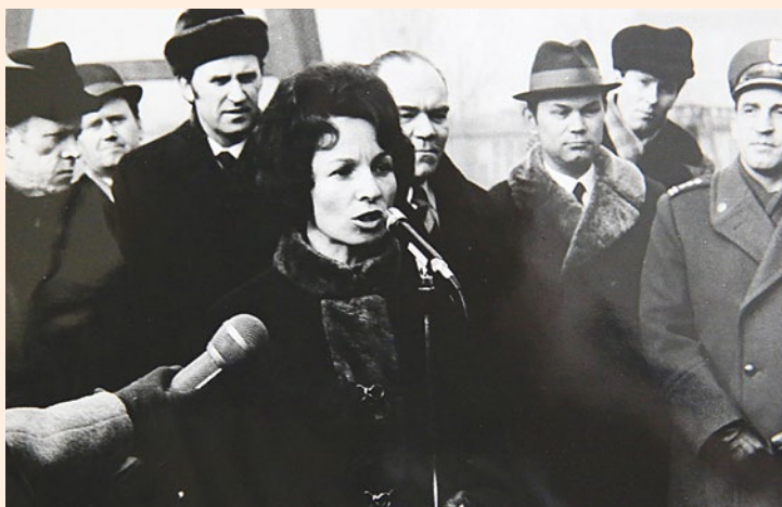
Uroczystość wodowania „Cedyni” w Stoczni Szczecińskiej im. Adolfa Warskiego.

jące mnie, że mam zostać matką chrzestną nowego peżetemowskiego statku o nazwie Cedynia, którego wodowanie ma odbyć się w piątek, 15 grudnia. Nie mogłam uwierzyć w to, co przeczytałam. Równie zaskoczone były władze Cedyni. Niebawem jednak wia-