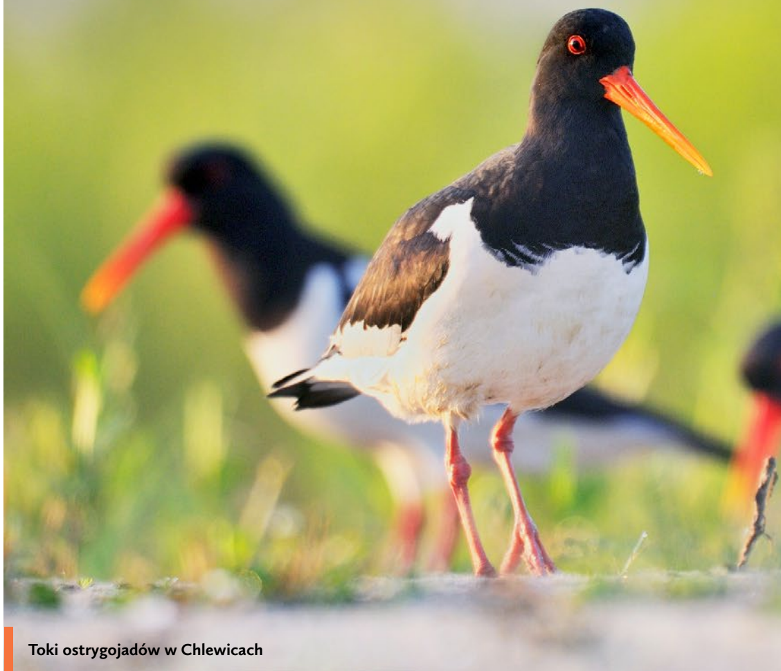
Toki ostrzygojadów w Chlewicach

W marcu 2017 roku Fundacja Zielonej Doliny Odry i Warty z siedzibą w Górzycy (woj. lubuskie) otrzymała dofinansowanie ze środków UE w ramach Programu Operacyjnego Infrastruktura i Środowisko (2.4.1) dla projektu „Ochrona lęgów fauny ptaków w Dolinie Odry poprzez tworzenie miejsc gniazdowych zapewniających bezpieczną inkubację i wyprowadzenie potomstwa”.