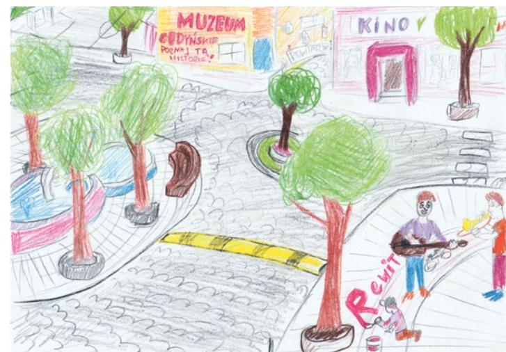
Praca Dominiki Czeszejko

Dziecięce prace pokazały, o jakiej Cedyni marzą najmłod-