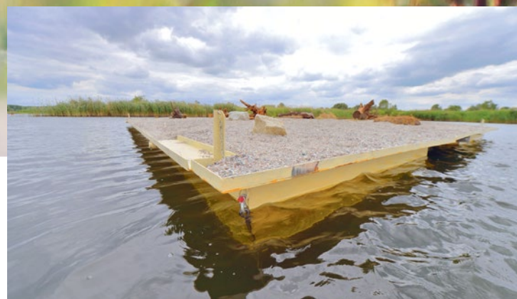
Pływająca wyspa z bliska