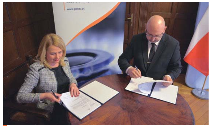
Burmistrz Cedyni podpisuje list intencyjny o współpracy z Polską Spółką Gazową

Inwestycja rozbudowy sieci dystrybucji gazowej w całym województwie zachodniopomorskim ma się zakończyć do końca 2022 r.