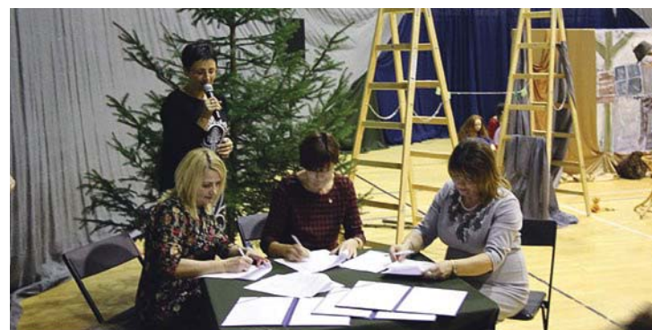
Burmistrz Cedyni podpisuje umowę o transgranicznej współpracy w ramach projektu „Polsko-Niemiecka Transgraniczna Kooperacja Edukacyjna na Obszarze Doliny Odry”.

W ramach projektu Gmina Cedynia planuje wykonać inwestycję polegającą na konserwacji wieży w Cedyni wraz z wykonaniem iluminacji zalewowej elewacji oraz zagospodarowaniem przestrze-