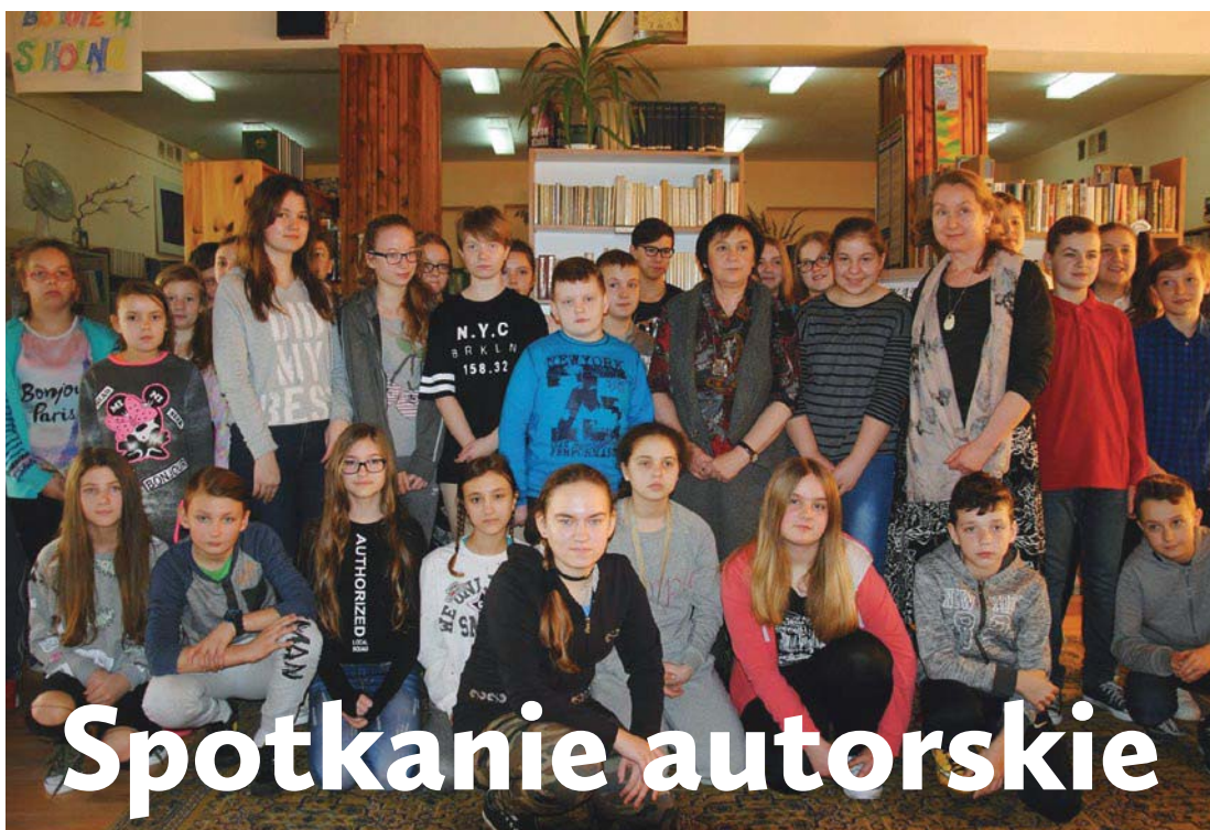
Znana autorka książek dla dzieci i młodzieży Renata Piątkowska gościła w dniu 22 marca 2017 r. w cedyńskich bibliotekach.

Spotkanie zorganizowano we współpracy z Biblioteką Miejską w Chojnie.