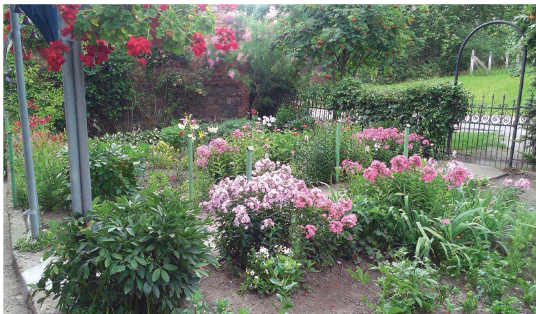
Ogrody zgłoszone do ubiegłorocznej edycji konkursu

Karty zgłoszeniowe należy składać w Urzędzie Miejskim w Cedyni (sekretariat) plac Wolności 1, w godzinach pracy urzędu tj. pn 8.00–16.00, wt–pt 7.30–15.30 lub przesłać pocztą/kurierem na adres: Urząd Miejski w Cedyni pl. Wolności 1, 74-520 Cedynia; do dnia 23 czerwca 2017 r. , do godziny 15.30; w zamkniętym opakowaniu/kopercie z dopiskiem: Konkurs pt. „Kwiatami Cedynię upiększamy” .