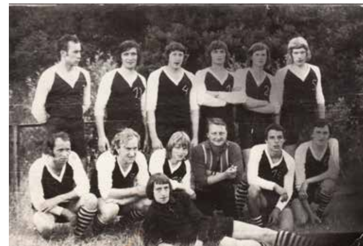
■ Drużyna w latach 70-tych XX w.

Klub Sportowy w Cedyni został założony 26 maja 1946 r. jako jeden z pierwszych klubów na terenie obecnego województwa zachodniopomorskiego. Początkowo nosił nazwę Klub Sportowy Cedynia, potem Pograniczne Cedynia. W pierwszych latach wiodącą dyscypliną była lekkoatletyka, w której Cedynia osiągała sukcesy. Klub był ważnym czynnikiem spajającym społeczność lokalną która osiadła tu po 1945r. Imię klubu Czycibor, ściśle nawiązywało do słynnej bitwy Mieszka I z 972 r.