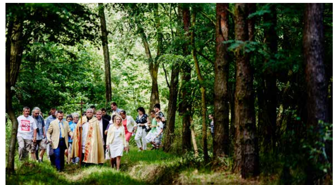
Premierowy spacer nową ścieżką do najdalej na zachód wysuniętego punktu w Polsce, 26.06.2016 r.

W planach jest korekta przebiegu nadodrzańskie pieszego szlaku czerwonego, tak aby przechodził on przez cedyński west cape. W najbliższych latach we współpracy z Nadleśnictwem Mieszkowice i Zespołem Parków Krajobrazowych ma powstać w tym miejscu infrastruktura turystyczna wraz z niewielkim parkingiem przy drodze wojewódzkiej 126. Natomiast dla turystów planowane jest wydawanie pamiątkowych certyfikatów po zdobyciu wszystkich czterech przylądków Polski.