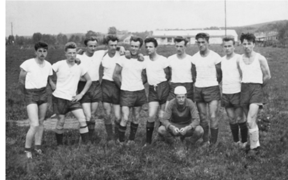
■ Lata 60-te XX w.

Klub Sportowy w Cedyni został założony 26 maja 1946 r. jako jeden z pierwszych klubów na terenie obecnego województwa zachodniopomorskiego. Początkowo nosił nazwę Klub Sportowy Cedynia, potem Pograniczne Cedynia. W pierwszych latach wiodącą dyscypliną była lekkoatletyka, w której Cedynia osiągała sukcesy. Klub był ważnym czynnikiem spajającym społeczność lokalną która osiadła tu po 1945r. Imię klubu Czycibor, ściśle nawiązywało do słynnej bitwy Mieszka I z 972 r.