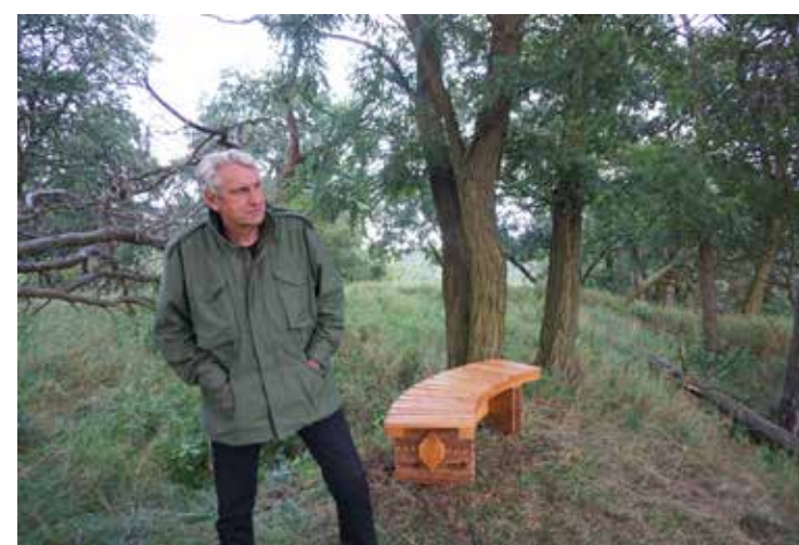
Podczas realizacji filmu, punkt widokowy w Siekierkach

późniejszych produkcji filmowych. Program, na którym wychowały się pokolenia Polaków, był ewenementem w czasach dwuprogramowej telewizji lat 80-tych w którym ubrany w skórzaną kurtkę młody dziennikarz w sposób swobodny i nietypowy, wprowadzał widza w świat zagadek historii. Sensacja- jak mówił pan Wołoszański- ówczesnie nie kojarzyła się z czymś negatywnym, wzbudzała inne skojarzenia- tajemniczości sprzyjającej poszuki-