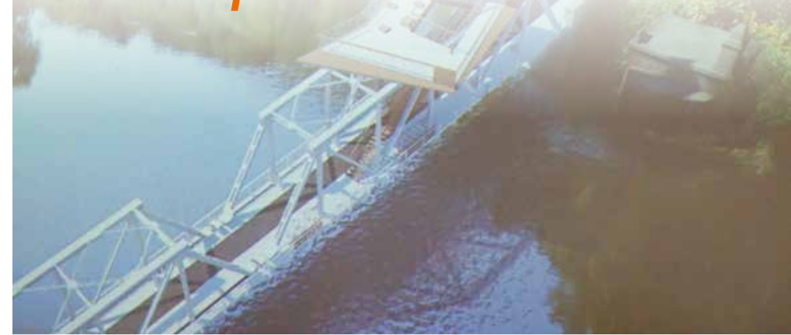
■ Na rewitalizowanym moście ma powstać platforma widokowa, projekt MXL4

wspólnie pracujemy nad rewitalizacją mostu Siekierki – Neurüdnitz. Jest to bardzo ważny projekt, ważny element koncepcji szlaków rowerowych Pomorza Zachodniego. Chcę byśmy wiedzieli na jakim etapie jesteśmy, by obie strony wiedziały, że wszystko przebiega transparentnie i wspólnie doprowadzimy ten projekt do szczęśliwego finału – powiedział Wicemarszałek Województwa Zachodniopomorskiego Jarosław Rzepa.