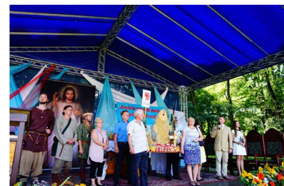
Prezentacja gminy i wienca na scenie podczas Dożynek Archidiecezjalnych w Pyrzycach