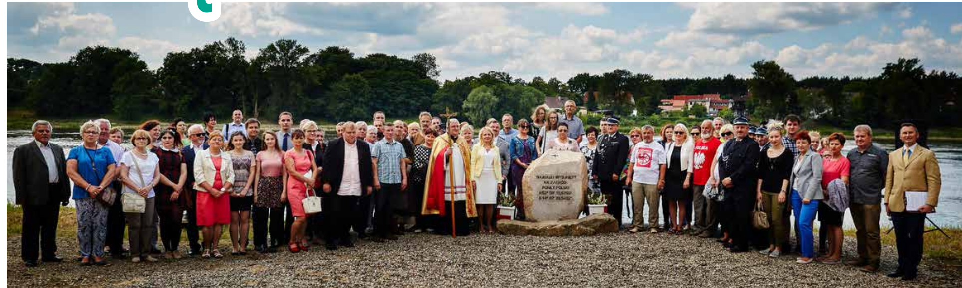
Uroczyste odsłonięcie pamiątkowego kamienia, Dni Cedyni, 26.06.2016 r.

Gmina Cedynia oznakowała swój geograficzny wyróżnik - najdalej na zachód wysunięty punkt w Polsce: zakole rzeki Odry pomiędzy Osinowem Dolnym a Starym Kostrzynkiem. Jest to już drugi oznaczony geograficznie przylądek naszego kraju. Pierwszy, pół-