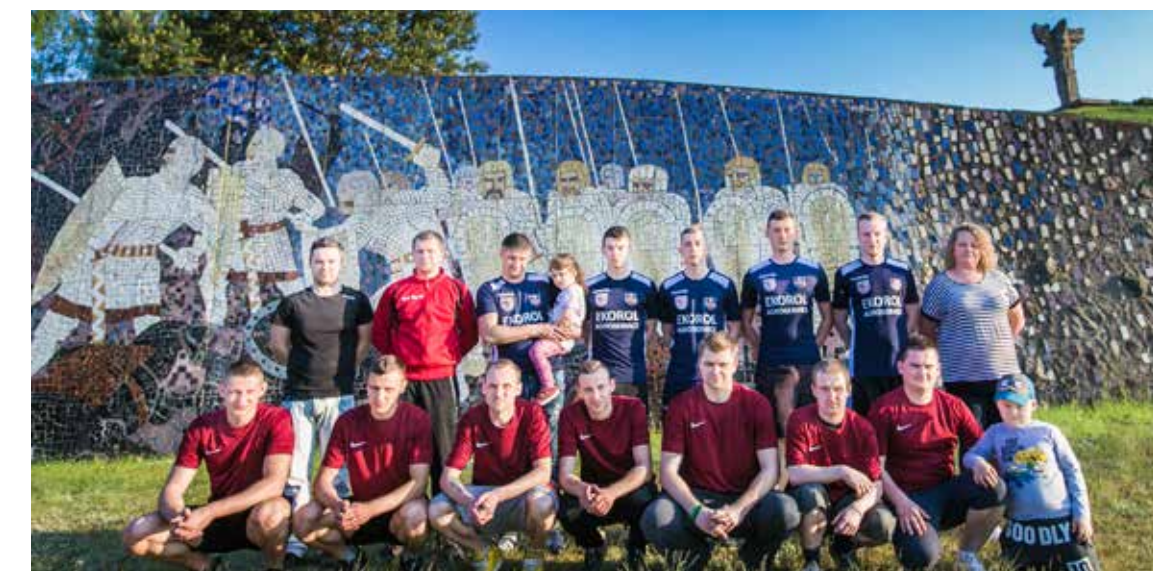
■ 2016 — pamiątkowa fotografia drużyny pod Górą Czycibora