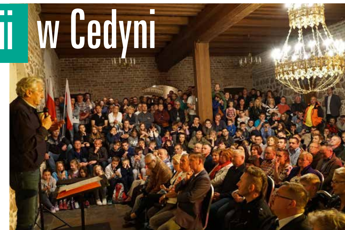
Na spotkanie z Bogusławem Wołoszańskim przybyły tłumy miłośników historii, 13.05.2016

waczom przysług. Program od 1983 roku ewoluował: zaczęło się od nagrań studyjnych, potem docierania do autentycznych miejsc związanych z II wojną światową - m.in. Linii Maginota czy fortu Eben Emael. W końcu - wykorzystywania potencjału grup rekonstrukcji historycznej. Programy przypominały widowiska historyczne. Oprócz amatorów, brali w nich udział nawet zawodowi aktorzy. Spotkanie z redaktorem