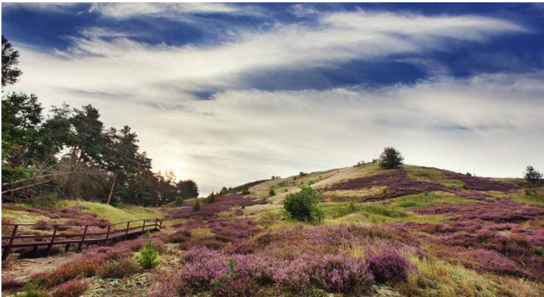
■ Rezerwat przyrody Wrzosowiska Cedynskie z nową ścieżką edukacyjną, fot. Michał Nieścioruk