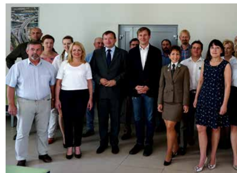
■ Partnerzy projektu podczas konferencji w Szczecinie, 1 lipca 2016 r.