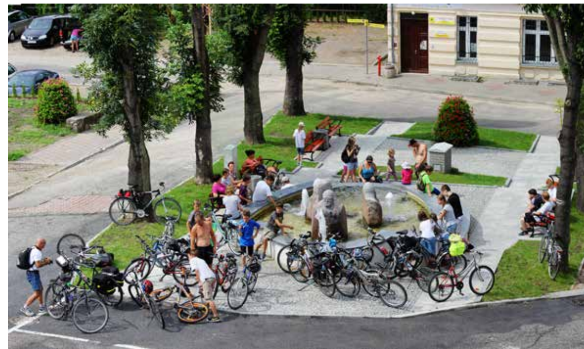
■ Rowerzyści przy fontannie na Placu Wolności w Cedyni

społecznych, znajomości i przyjaźni w środowisku miłośników jednośladów, zwiększenie zdobytego doświadczenia przy współrealizacji projektów w ramach programu Interreg, poprawa bezpieczeństwa uczestników ruchu rowerowego, oraz dalszy rozwój infrastruktury rowerowej.