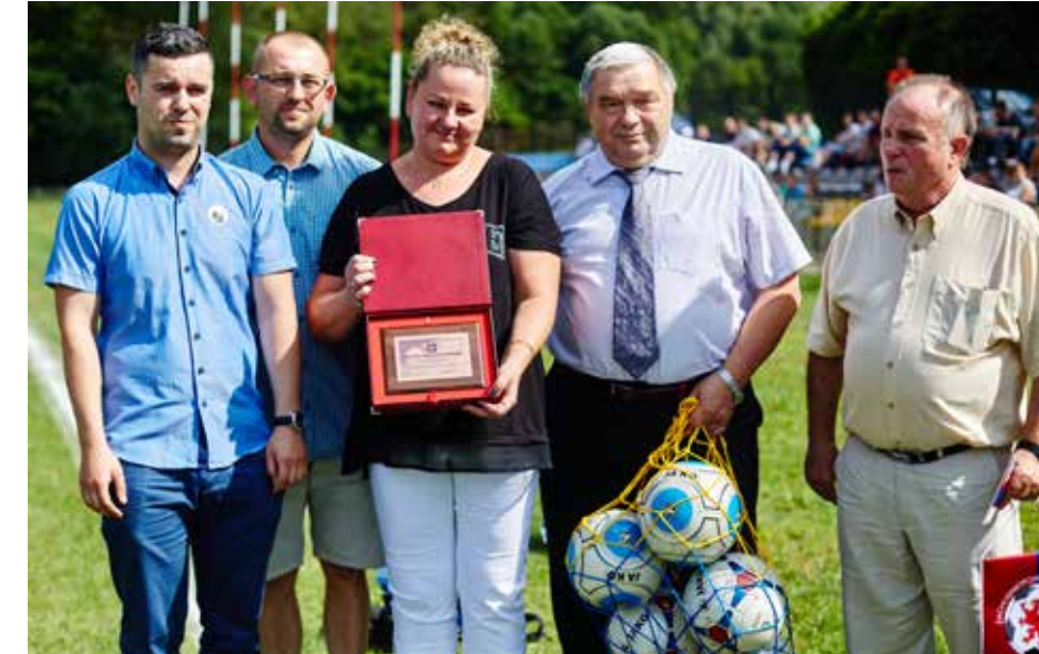
■ UKS Czycibor Cedynia uhonorowany przez Zachodniopomorski Związek Piłki Nożnej