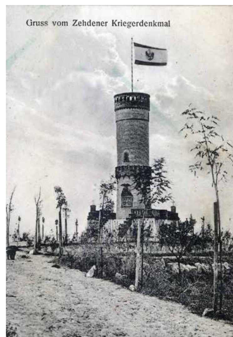
Wieża w Cedyni zbudowana w 1895r. jako pomnik pamięci żołnierzy urodzonych w Cedyni, poległych w wojnach prowadzonych przez Prusy. Kartka pocztowa ze zbiorów Bysarada Mateckiego.

Źródła: M. Słonimski, Karta ewidencji na zabytku. Szczecin 1996 r., E. E. Melcher, Der Aussichtsturm auf dem Schützenberge bei Zehden. W: „Mitteilungen des Touristenclubs für die Mark Brandenburg, 4, 1895