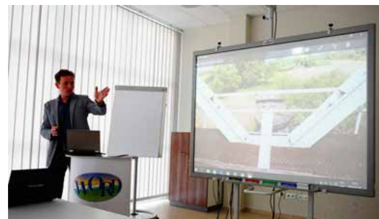
■ Prezentacja koncepcji przebudowy mostu w Siekierkach, MXL4

na podstawie: Marek Mucha, Biuro Prasowe, Urząd Marszałkowski Województwa Zachodniopomorskiego