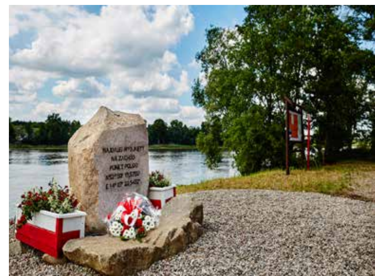
Kamień z danymi geograficznymi cedyńskiego west cape

Kamień ustawiono w współpracy Gminy Cedynia, oraz Cedyńskiego Ośrodka Kultury i Sportu, przy wsparciu Starostwa